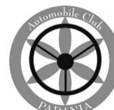
AUTOMOBILE CLUB PADANA