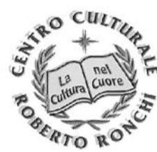
CENTRO CULTURALE ROBERTO RONCHI

Gli Alpini padani saranno presenti con due gazebo a Pontida dove potranno ribadire le finalità del loro corpo, proteso alla difesa delle proprie genti e alla salvaguardia del territorio. Inoltre l'associazione sta cercando di concordare con i politici la riapertura delle caserme degli alpini, ormai quasi tutte chiuse. Il 28 giugno è in programma una gita sul lago di Garda al Museo storico italiano della guerra, un appuntamento che servirà per tenere sempre vivo il ricordo di chi ha combattuto per il Paese.