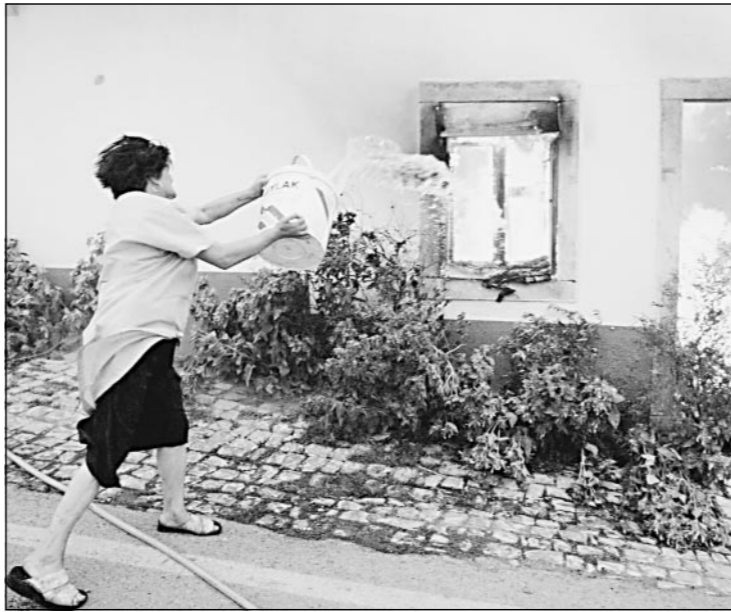
Una donna cerca di spegnere a secchiate l'incendio della sua casa nel villaggio di Aldeia da Torre, in Portogallo

A Parigi si sfiorano i 42 gradi, e il limite di velocità è stato abbassato a 30 km/h per paura dell'ozono. A Strasburgo hanno dovuto annaffiare una centrale nucleare surriscaldata dal troppo sole.