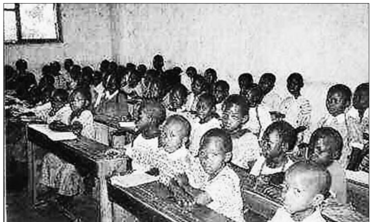
Una delle scuole elementari del Kenia. Il nuovo governo vuole rendere obbligatoria e gratuita l'istruzione scolastica