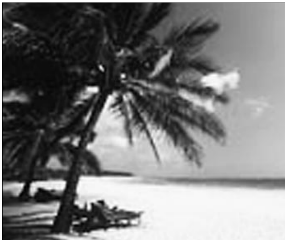
Una spiaggia del Kenia. Il turismo è l'unica risorsa che può garantire lo sviluppo