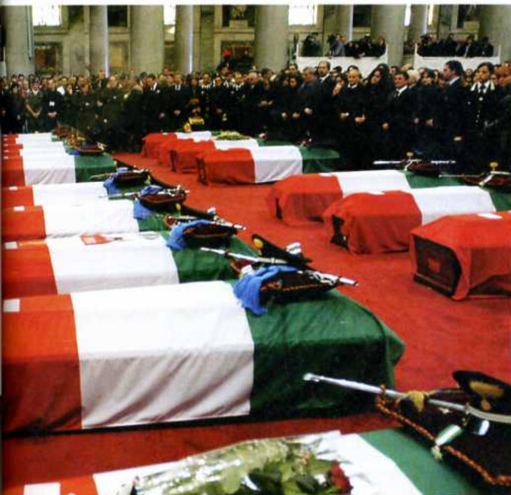
A sinistra, il dolore di due parenti di una delle vittime. Sopra, il momento della benedizione delle bare e, sotto, il vescovo di Caserta Raffaele Nogaro